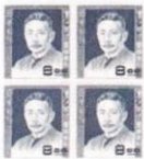
文化人切手 夏目漱石