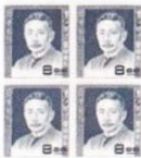
文化人切手 夏目漱石